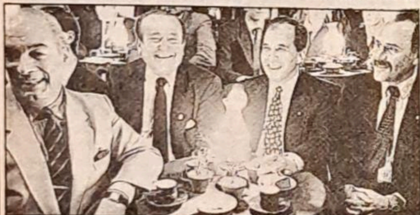
Nerviosismo deportivo en el espectáculo: dirigentes de Colo Colo y Olimpia antes del trascendental partido en el Monumental.